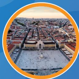
PRACA DO COMÉRCIO 🚆 16min 🚗 21min