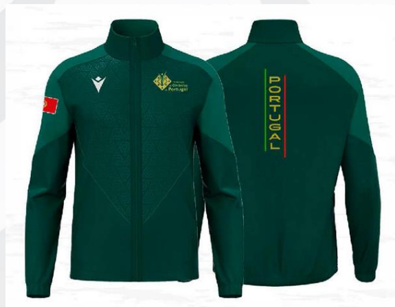
Fato de Treino: