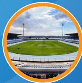
ESTÁDIO DO RESTELO 🚆 31min+ 🚗 22min