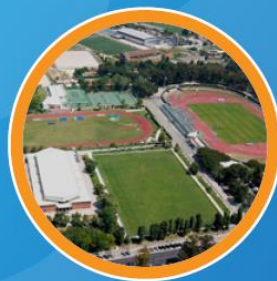
ESTÁDIO UNIVERSITÁRIO DE LISBOA 🚆 24min