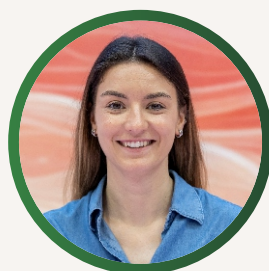
Márcia Sobral Comunicação