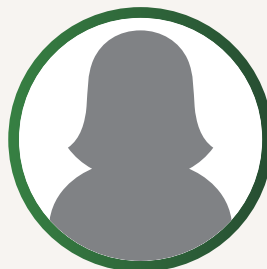
Bárbara Sousa - POR Desporto Escolar