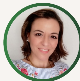
Susana Sousa Design Gráfico