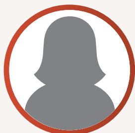
Clara Gouveia - POR Desporto Escolar