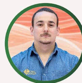
Ruben Pereira Logística